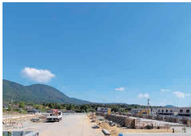
令和5年10月の工事状況