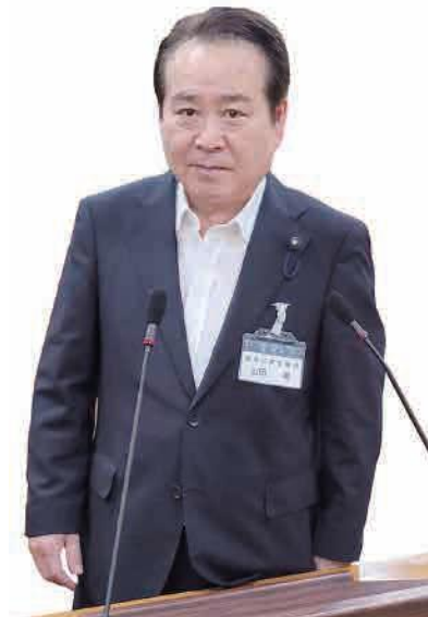
やまおか とおる 議員 山岡 徹