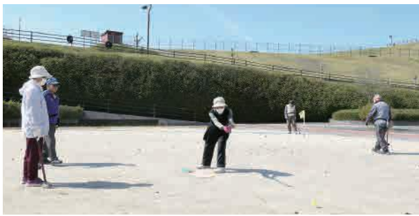
いつまでも健康で