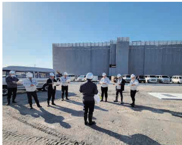
令和6年3月に厚生建設産業常任委員会で視察