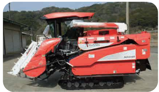
高性能コンバイン

五徳農事組合法人に続き、中組地区の農事組合法人かわら夢ファームが県及び町の補助金を活用しコンバインを購入。