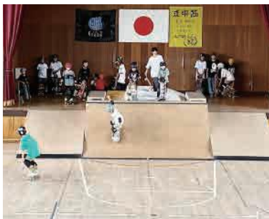
盛り上がるスケートパーク