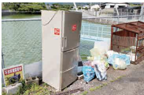
ごみ集積所の違反ごみ

地域によっては、隣組未加入者もごみ集積所を使用し、区以外の人が通りすがりに捨てている状況がある。違反ごみもあり、非常に不衛