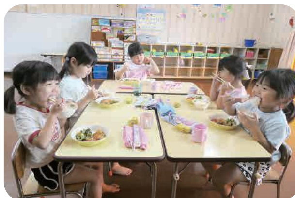
あたたかい おいしい うれしい

戦後の昭和24年に保育所の給食が始まりましたが、当時の日本の食料事情や財政状況から、主食を各家庭で用意することになりました。その後、給食費に関する国の制度が何度か変わっても、主食を持参するルールだけが残っていました。