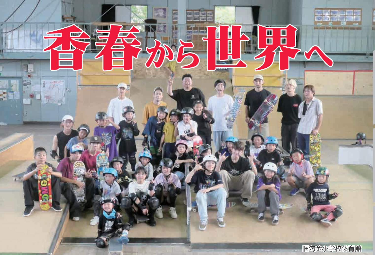
旧勾金小学校体育館