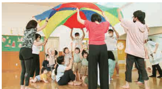
育てやすい環境を

答 鶴我町長 今年度も給食費の無償化を実施したが、恒久的な財源がないと厳しい。国等に補助支援を確立してもらうように要望していく。