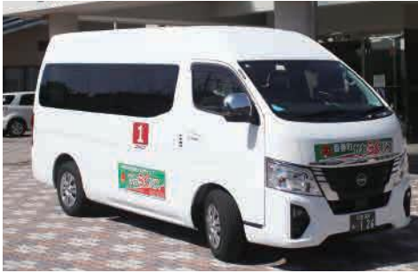
もっと便利に かわらくバス