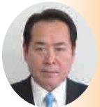
やまおか とおる 山岡 徹議員

議会広報100号を迎え、歴代の編集委員の足跡に感謝を申し上げます。自然と産業と人々が穏やかに「調和・共存」するまちで、町民と議会と行政が一体となった「協働のまちづくり」を目指していくため、今後も皆様と一体となった議会広報を発行していきたいと思っております。