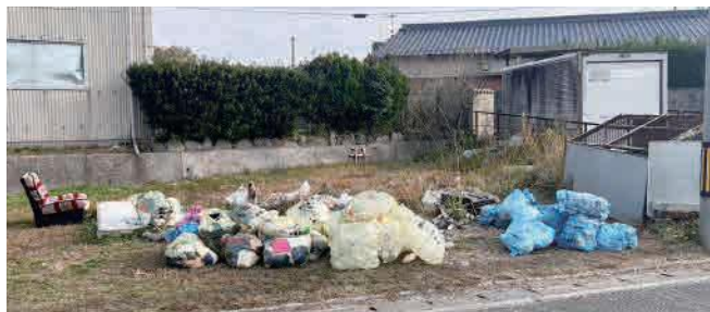
対策に悩む ごみ集積所