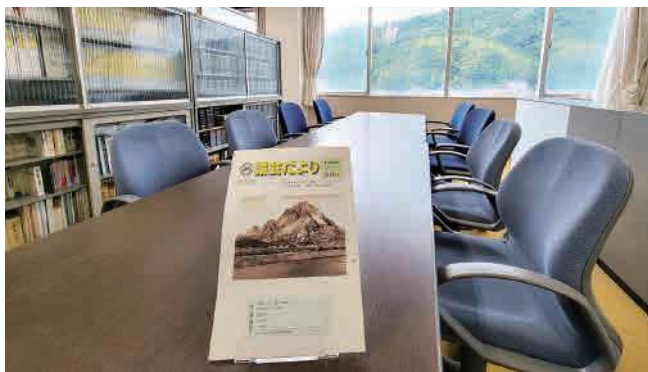
閉会中も集まることができるようにと、創刊号の編集から広報編集室が誕生。

いただきました。この体験を通じて議会の活動や議会だよりに興味をもってもらい、さらに自分たちの住む町に関心を寄せるきっかけとなるよう、委員一同も取り組みました。 私達広報委員は、創刊100号を発行できたことを誇りに思い、次世代へ繋げていけるよう、今後とも議会の取り組みや活動があらゆる世代の町民の皆さんへ伝わる議会だよりの発行に取り組んでまいります。また、各地域の抱える課題や町民皆さんの声を行政に届け、結果を出せるよう広報・広聴活動に議会議員一同全力で力を注いでまいります。今後とも、「議会だよりかわら」をよろしくお願いいたします。