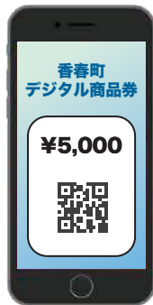
デジタル商品券 イメージ

プレミアム率20%の商品券、3500冊を令和6年8月頃に申込開始予定。3500冊のうち1500冊はデジタル商品券として販売予定。