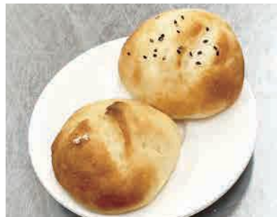
グルテンフリー生米パン