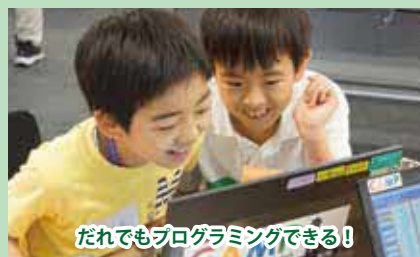
自分たちでつくった作品が動く楽しさ