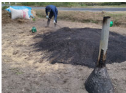
▲最後は全体に広げて水散布で冷却。最終的に30時間程度かかって完成しました。

採銅所駅舎内第二待合室で、初めて映画の自主上映イベントを開催しました！上映した映画は「Cantata - Timor」で、東ティモールという国がインドネシアから独立するまでを描いたドキュメンタリーです。参加者の中には、初めて香春町を訪れた人も多く、山口県から来た人もいました。自主上映イベントを通して、香春町のアピールに成功したと感じました。今後はイベント等を通じて、町内外の人が触れ合う機会を多く作りたいと思います。外から来た人は、町内の人と直接話し、香春町の雰囲気を感じることが一番魅力が伝えられると思いました！