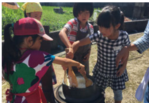
▲お釜で炊いたお米を混ぜる子どもたち。

10月5日(土)、柿下公民館で、食べた笑顔になるおむすび教室を開催しました。ちびっこも含め、総勢30名を超える人たちが参加し、賑やかに行うことができました。着任後、柿下で畑を借りたことでご縁ができた人たちにも応援で参加してもらい、とても嬉しかったです。また、「何も無いと思っていたこの土地に、こんなに外から人が来てくれるなんて！」という驚きの声と「またやって！」の声を多くもらいました。とても楽しかったので、またやります！前回参加できなかった人も、是非チェックしてください！